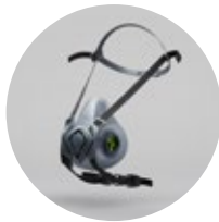
Media máscara BLS 4000 neXt R