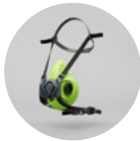
Media máscara BLS 4000 neXt S