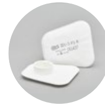
Filtros planos serie BLS 201