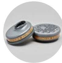
Filtros serie BLS 200